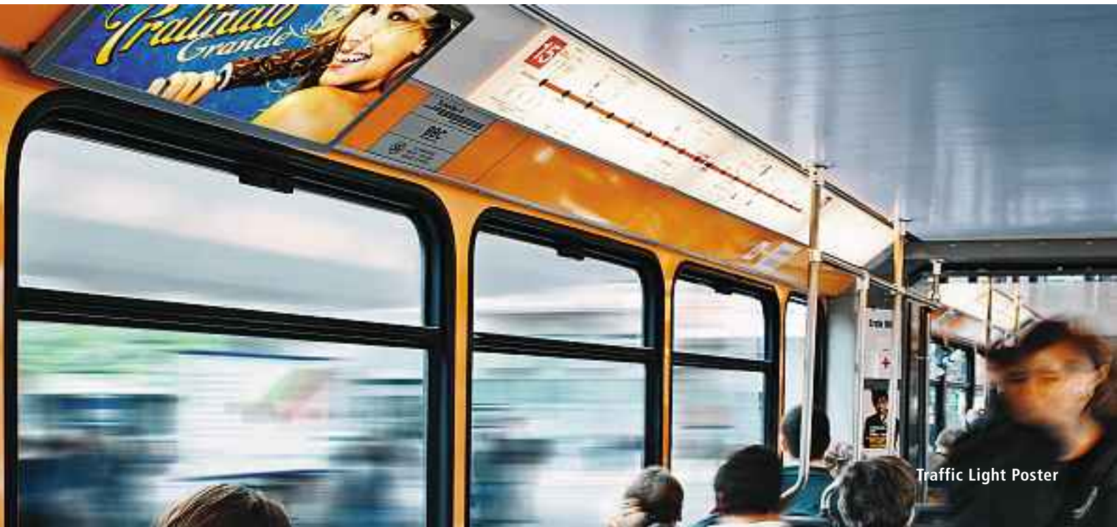
Traffic Light Poster